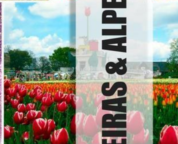
Travessia dos Alpes