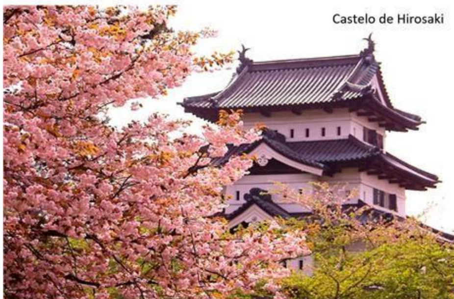
Castelo de Hirosaki